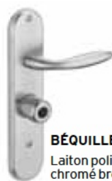
BÉQUILLE Laiton poli ou chromé brossé