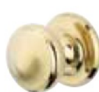
POMMEAU (en option) PVD laiton poli ou chromé velours