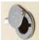
MICROVISEUR Chromé ou laiton